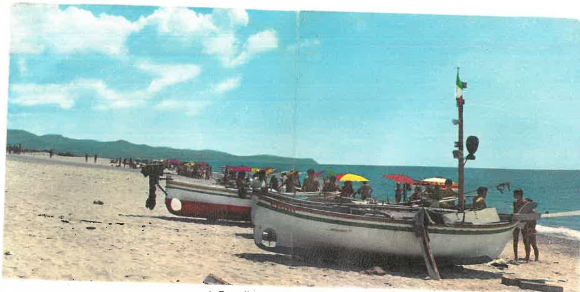
▲ Bovalino Marina "La spiaggia"

□ BOVALINO MARINA: Una località ideale per le vostre vacanze sul mare. Ad un'ora di macchina dall'aeroporto di Reggio Calabria. Sulla costa dei gelsomini, in una terra antica, ricca di panorami stupendi, di sole, di una spiaggia di sabbia bianca. Due moderni alberghi vi offrono una ospitalità completa.