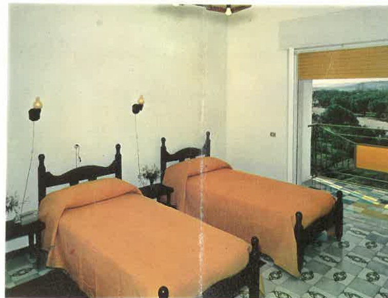
▲ Camera da letto - Hotel Orsa Sud