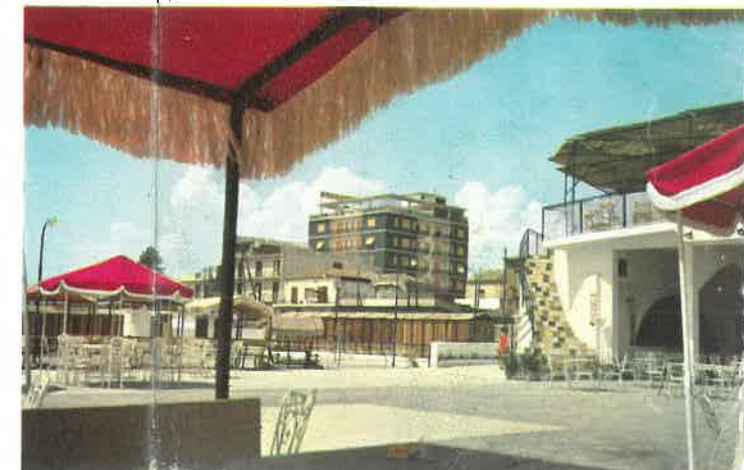
▼ Il Lido Orsa